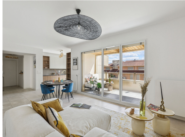
Programme Immobilier d'Exception à Villeurbanne

Vous recherchez un investissement locatif de qualité supérieure avec une rentabilité nette de 7% ? Découvrez ce programme immobilier unique situé dans un quartier premium de Villeurbanne, à deux pas du métro Charpennes.